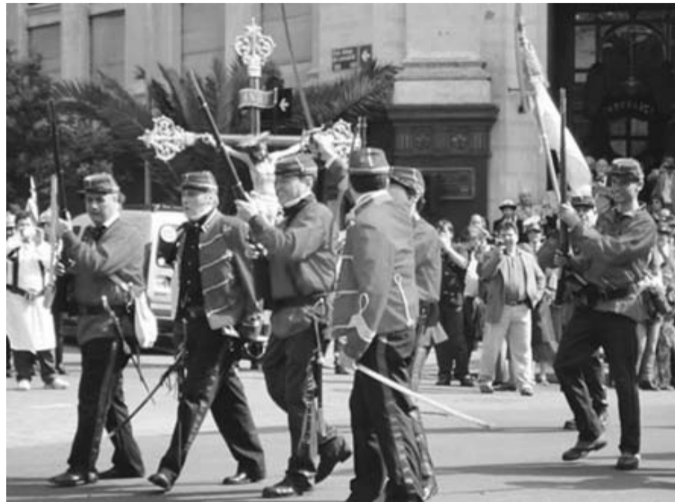
Recreación histórica del «Combate de los Potreros de Langdon» frente al Museo Histórico de La Boca. 23-08-2014.