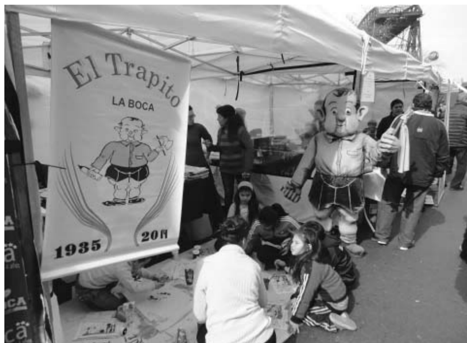
Stand de la Asociación El Trapito. Feria de Entidades Barriales. «La Boca Cumple 144 años Vuelve La Fiesta». 30-08-2014.