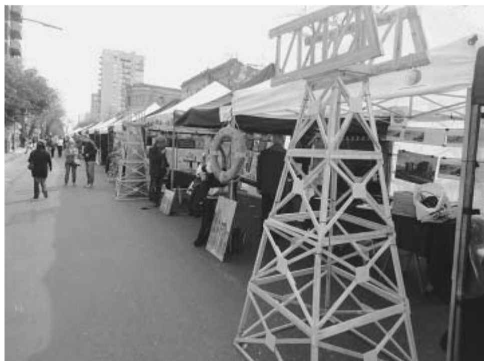
Stand de la Asociación Amigos de Barraca Peña y del Museo de Arqueología de La Boca. Feria de Entidades Barriales. «La Boca Cumple 144 años Vuelve La Fiesta». 30-08-2014.