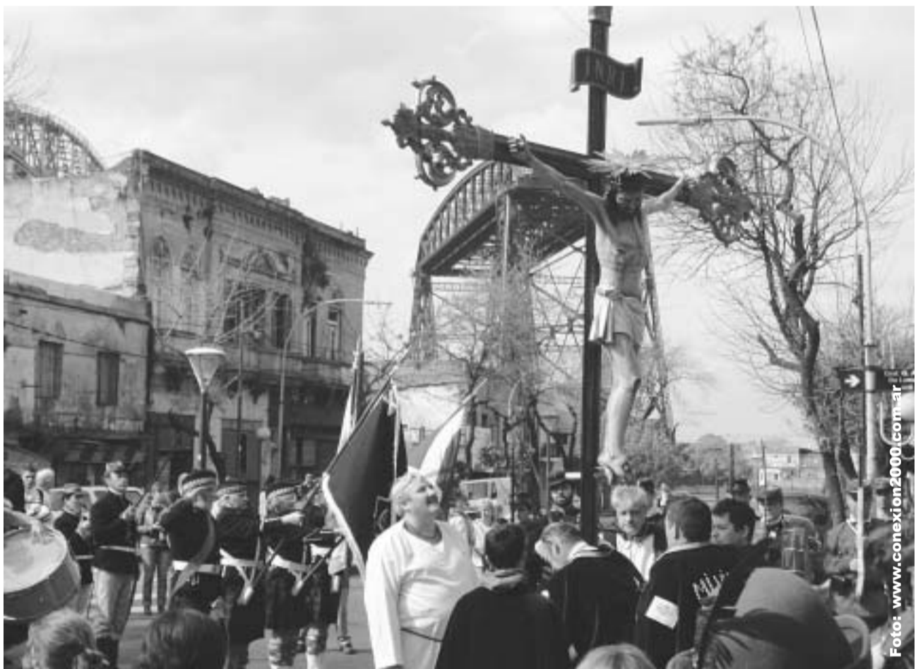
Desfile de evocación del pasado Boquense frente a la Fundación Museo Histórico de La Boca (23-08-2014).

En ambos festejos, a los que asistieron vecinos de los más variados sectores sociales se vio fuertemente reflejada la identidad boquense. Fueron un espacio para el reencuentro de aquellos que permanecen en el barrio con los que alguna vez lo habitaron y sirvió además para mostrar que a pesar de tantas cosas, La Boca sigue viva en su cultura y sus tradiciones.