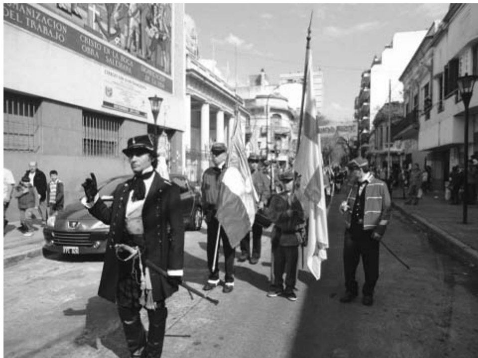
Desfile por la calle Olavarría del Cuerpo Cívico de Recreación Histórica de la República de La Boca «Legión Italiana Voluntarios de La Boca». Fundación Museo Histórico de La Boca. 23-08-2014