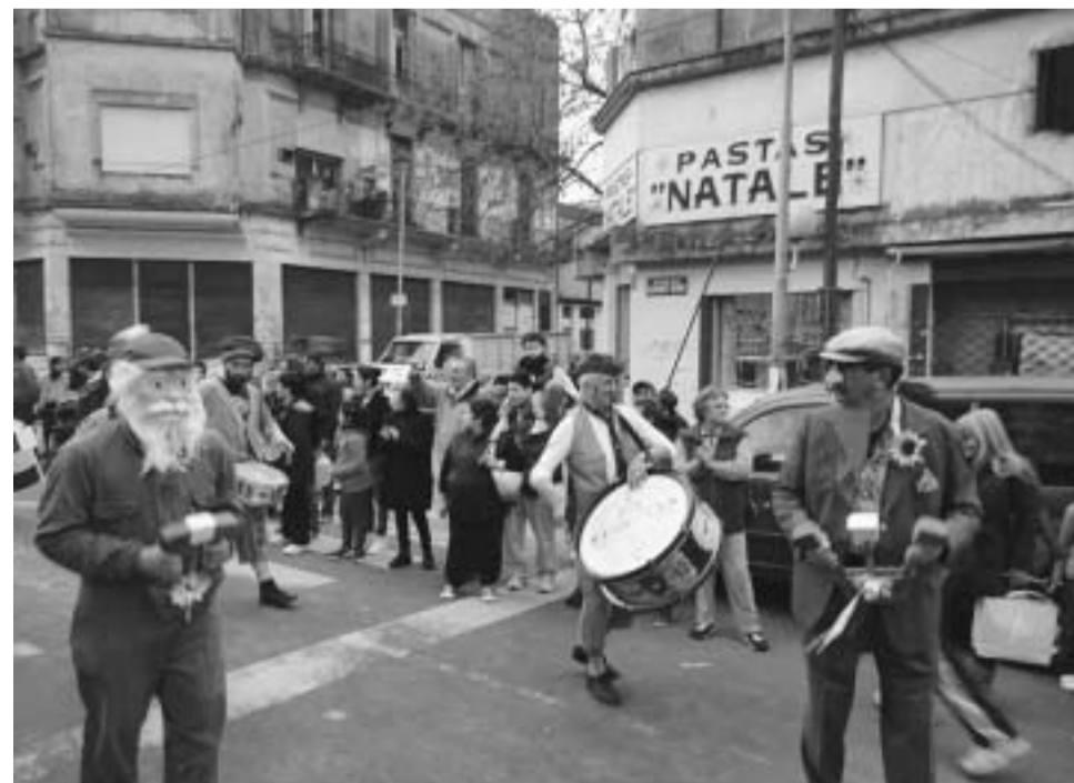
Desfile de la Comparsa Los Linyeras. «La Boca Cumple 144 años Vuelve La Fiesta». 30-08-2014.