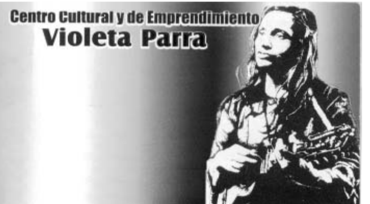
Centro Cultural y de Emprendimiento Violeta Parra

Con 8 años de trabajo, la apuesta mayor del Centro Cultural Violeta Parra no solo pasa por mantener vivas