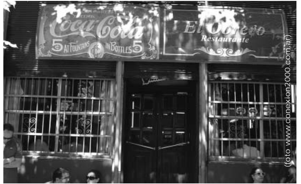
Restaurante «El Obrero» Año 2015

Durante el Siglo XX, sus clientes fueron principalmente trabajadores del puerto, de las fabricas lindantes como la Ford