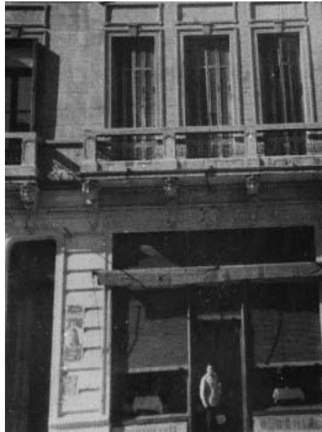
Restaurante «El Obrero» Foto Año 1954