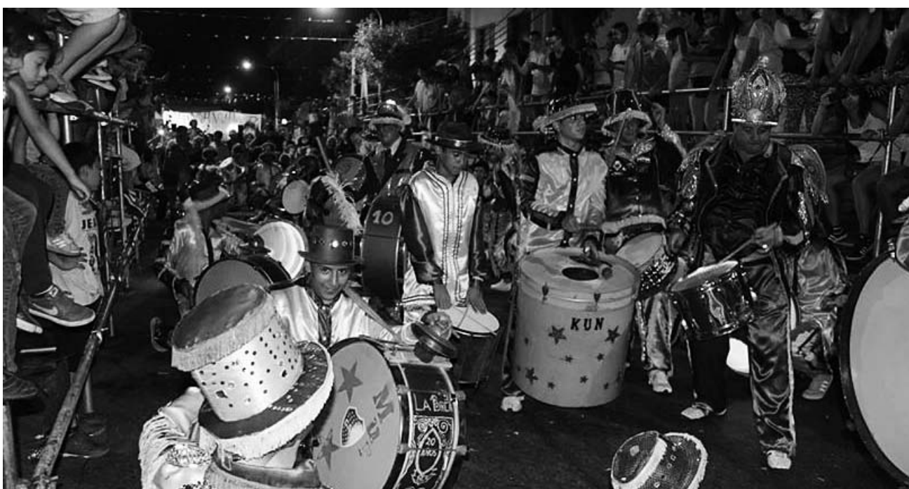
Los Amantes de La Boca.