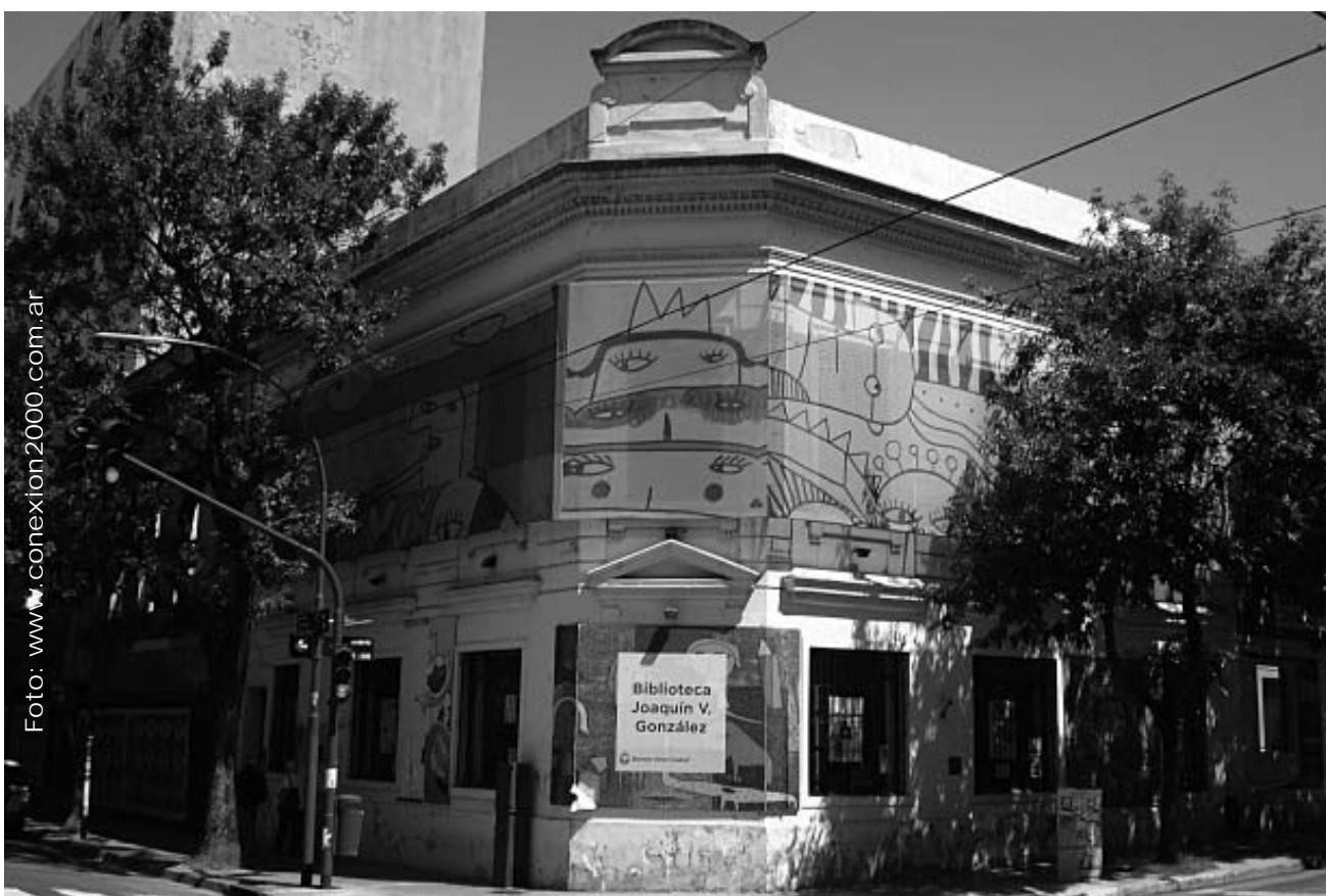
Biblioteca Joaquín V. Gonzalez (Año 2015)

Si bien La Boca contó con bibliotecas populares en centros sociales y políticos a lo largo de su historia, lo cierto es que fue recién en 1960 cuando la Municipalidad de la Ciudad de Buenos Aires resolvió instalar una estatal en el barrio, en una vieja casona en la intersección de la Av. Almirante Brown y Suárez.