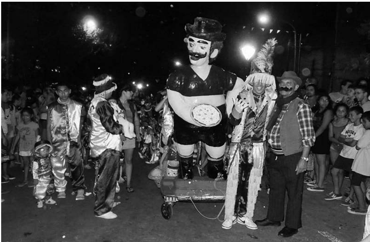
Los Amantes de La Boca.

Por el Corso de la Av. Benito Pérez Galdós ya desfilaron no solo las murgas y comparsas locales como Los Amantes de La Boca , Los Linyeras , Los Pibes de Don Bosco , sino también Los Goyeneche de Barrio Mitre, Los Mimados de la Paternal, Los Girosos de Pompeya, Los Dichosos de Villa Crespo, entre otros.