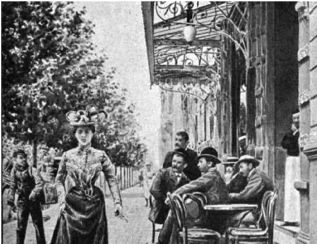
Ilustración de «Sanuy» denominada «El Aperital» publicada en Caras y Caretas del 2 de marzo de 1901 que nos muestra, cual una fidedigna fotografía, una escena de febrero del año 1901 en alguna vereda de Buenos Aires. Indudablemente, se trata de parroquianos sentados frente al mítico café Tortoni en el grandioso escenario de la Avenida de Mayo.

Así la sede de la peña, llamada Agrupación Gente de Artes y Letras, se inauguró el 24 de mayo de 1926. Entre los asistentes se encontraban, Alfonsina