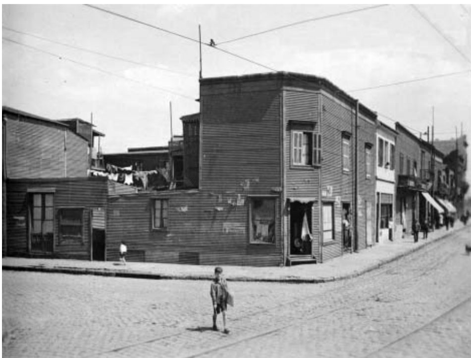
Pedro de Mendoza y Suárez. Año 1938.

El muelle servía también para hacer nuestros picados de fútbol. El problema surgía cuando la pelota se nos caía al río. Como no la podíamos perder, alguno bajaba por los