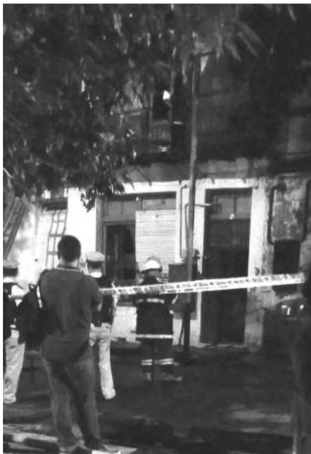
Serios inconvenientes para encontrar bocas de agua para conectar las mangueras.

Efectivos de los cuarteles de Bomberos Voluntarios de Vuelta de Rocha, La Boca y San Telmo, y cinco dotaciones del Destacamento «Boca» de Bomberos y de la División Cuartel III «Barracas» de la Policía Federal, participaron del control del siniestro. Las personas rescatadas, cuatro mayores, uno de ellos en estado grave, y tres menores, fueron trasladados al Hospital General de Agudos Dr. Cosme Argerich.