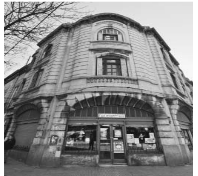
Olavarría y Palos. Año 2015.