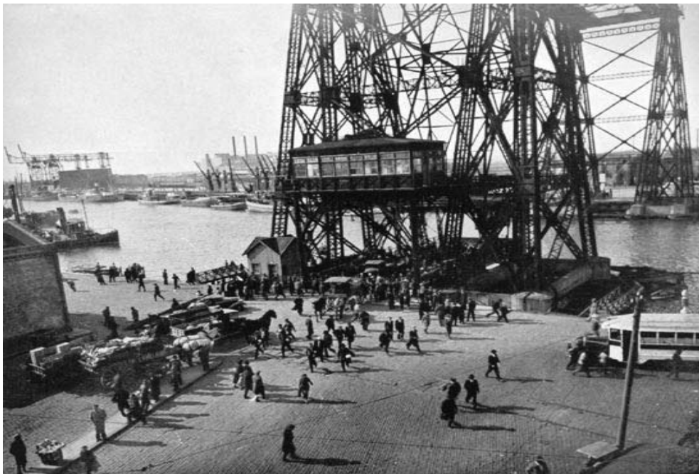
Puente Transbordador.

tensamente con el río durante muchos años, soportando sudestadas e inundaciones, sin ningún tipo de resarcimiento económico.