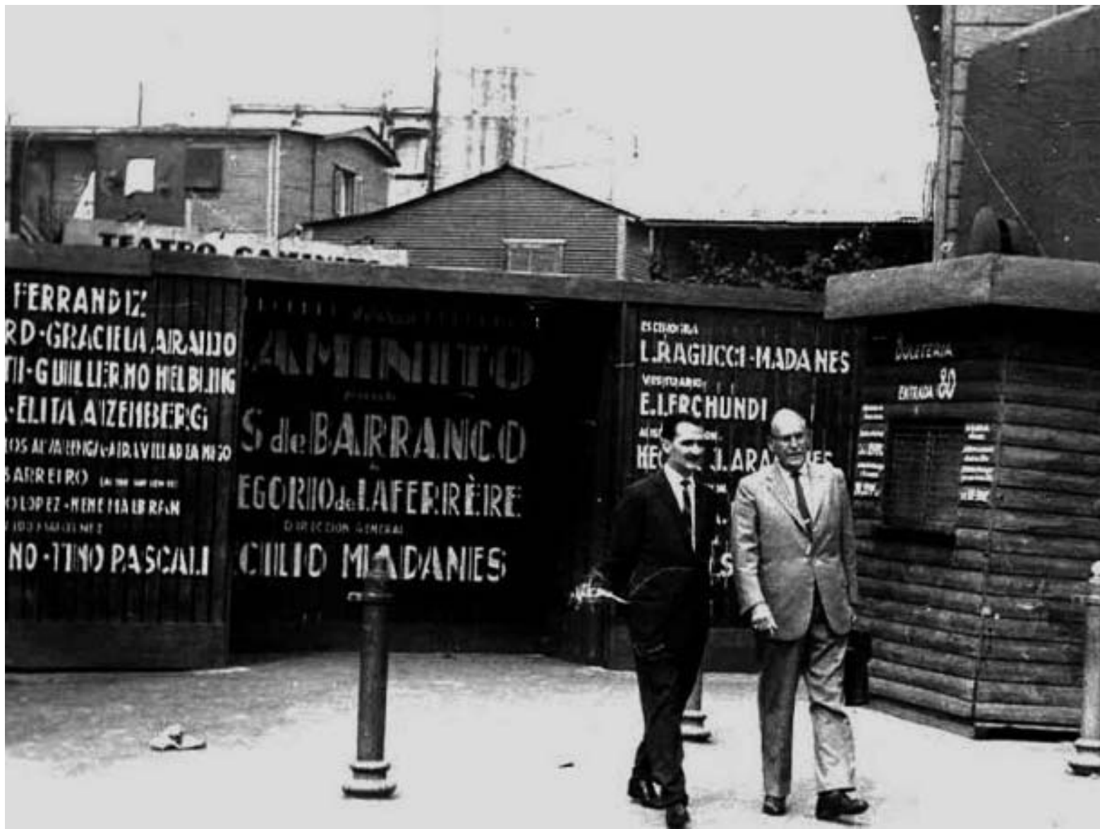
Teatro Caminito. Obra «Las de Barranco» Temporada: 1962-63 Fecha de estreno: 6 de diciembre de 1962.

La entrada será libre y gratuita, con capacidad limitada y en caso de lluvia la función se llevará a cabo la fecha siguiente según la Programación.