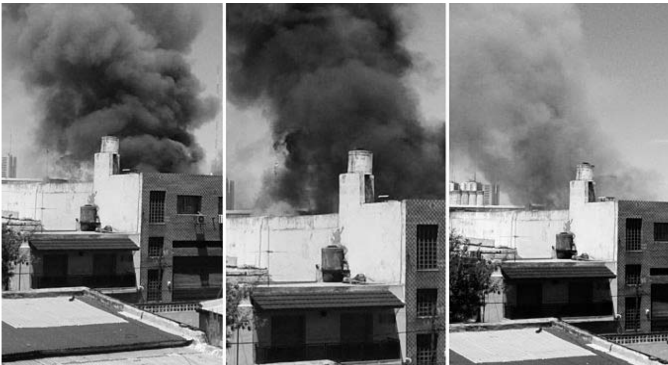
Siete dotaciones de Bomberos Voluntarios de La Boca, bomberos de la Policía Federal y unidades del SAME participaron de un operativo para combatir el fuego desatado en la casa de inquilinato.