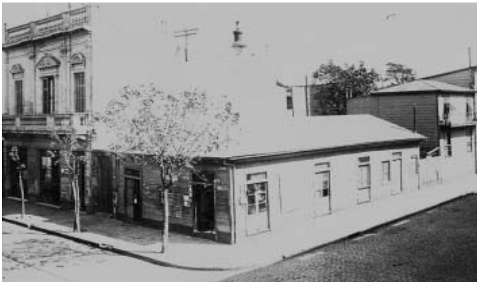
Olavarría y Palos. Principios del Siglo XX.

Olavarría fue desde siempre la calle principal de La Boca. Allí se instalaron los principales comercios, entidades y profesionales. La esquina de Palos y Olavarría es sin dudas una de las más tradicionales del barrio. En la década del '20 del siglo pasado, la destacada maestra