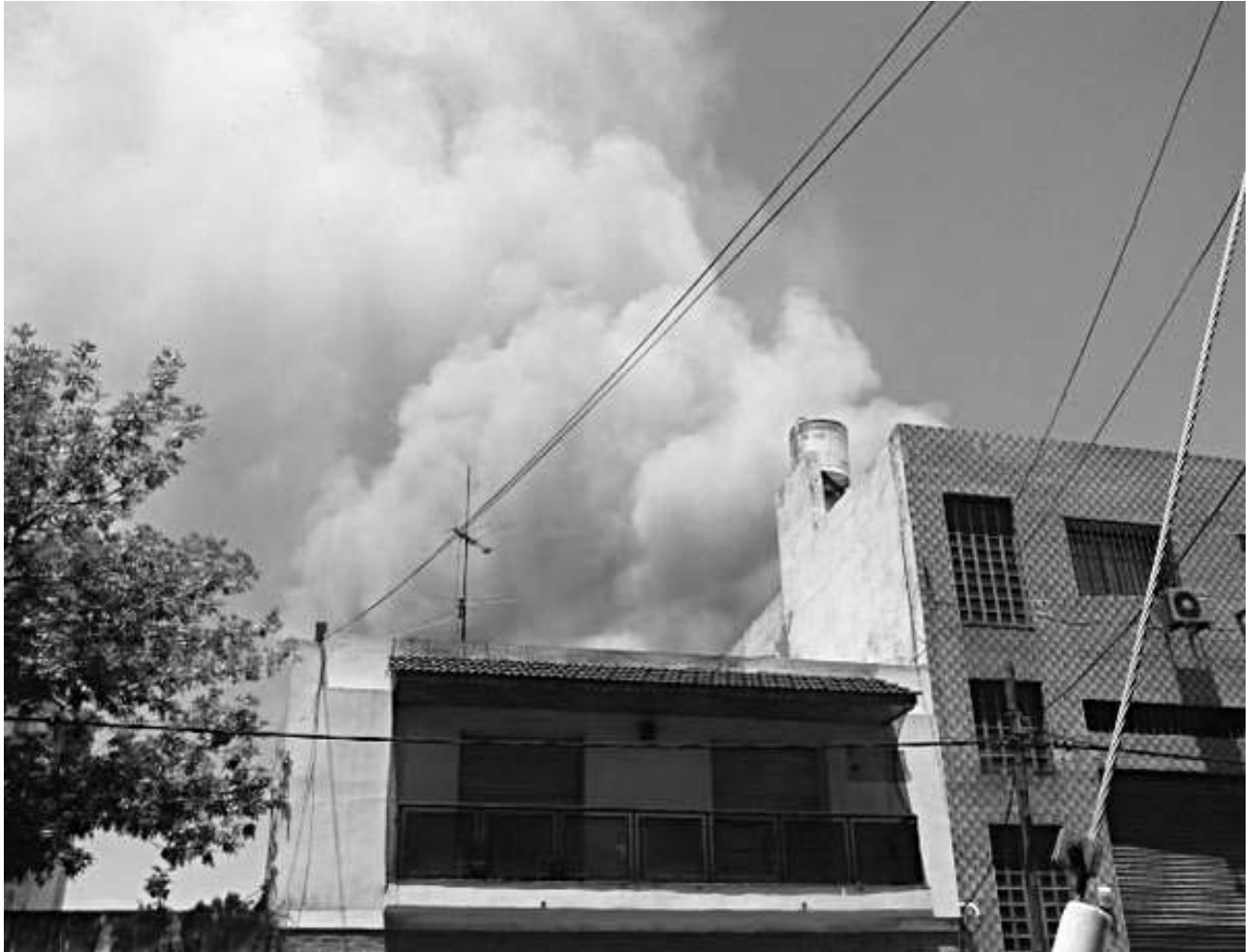
Gran columna de humo negro generada por el fuego era visible a la distancia.

Recién la semana posterior, sobre el filo del Año Nuevo, aparecieron algunas respuestas. Desde entonces, las familias intentan reubicarse de la manera más adecuada. Pero mucho de lo perdido será irremplazable, y los lugares conseguidos no alcanzan a satisfacer las necesidades de aquellos núcleos que tienen muchos pibes y requieren un predio de dimensiones razonables.