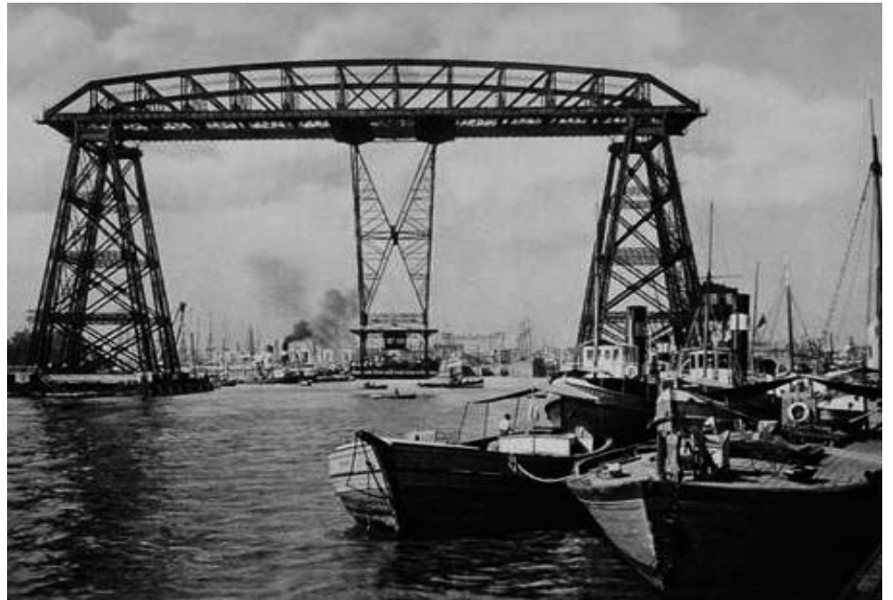
Foto: Puente Transbordador - La Boca (año 1951 circa). El Puente Transbordador Nicolás Avellaneda es único en América. Entre los siglos 19 y 20 se construyeron 20 similares en todo el mundo y en la actualidad es uno de los ocho que aún se conservan.

Era gratuito, y cumplía con el objetivo de transbordar a los trabajadores de un borde a otro, de allí su nombre. Recordemos que por aquellos años los frigoríficos, desarrollaban sus tareas durante las 24 horas y los trabajadores rotaban sus turnos, lo que los ponía al sonar las sirenas en las calles,