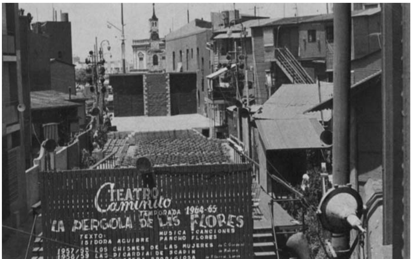
Teatro Caminito. Año 1964/1965.