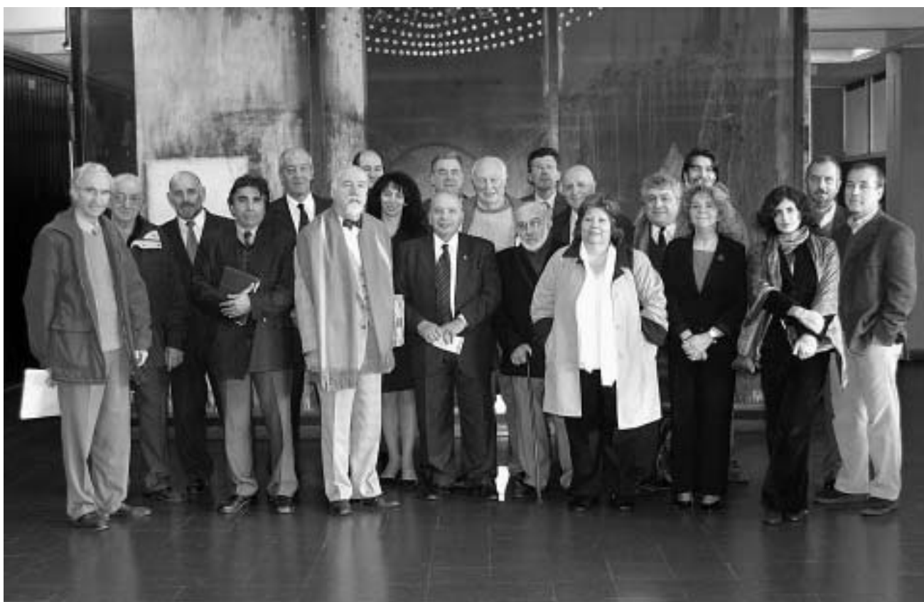
Firma del Convenio de Reciprocidad entre el Movimiento Vecinal por el Resurgimiento de La Boca y la Universidad de Morón.

Las opiniones expresadas en los artículos firmados, son responsabilidad de sus autores y no necesariamente reflejan la opinión de la editora. Las colaboraciones son ad-honorem. Está permitida la reproducción total o parcial del material de esta publicación citando la fuente.