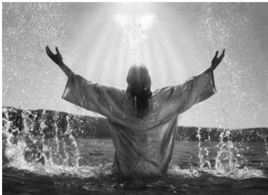
Jesús, Fuente de Agua Viva y Vida eterna.

Por haberse olvidado que no hay fuerza más