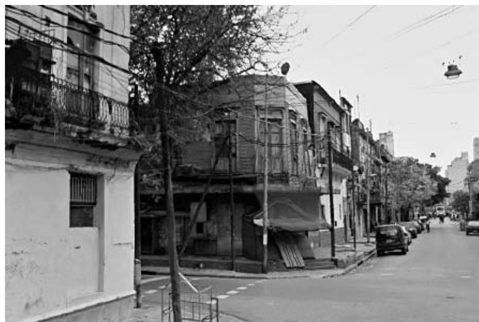
Olavarría y Necochea. Año 2014.

Más de 100 años atrás, Olavarría y Necochea era una de las esquinas con mayor vida nocturna de La Boca.