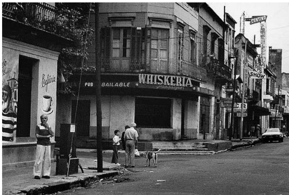
Olavarría y Necochea. Año 1993.